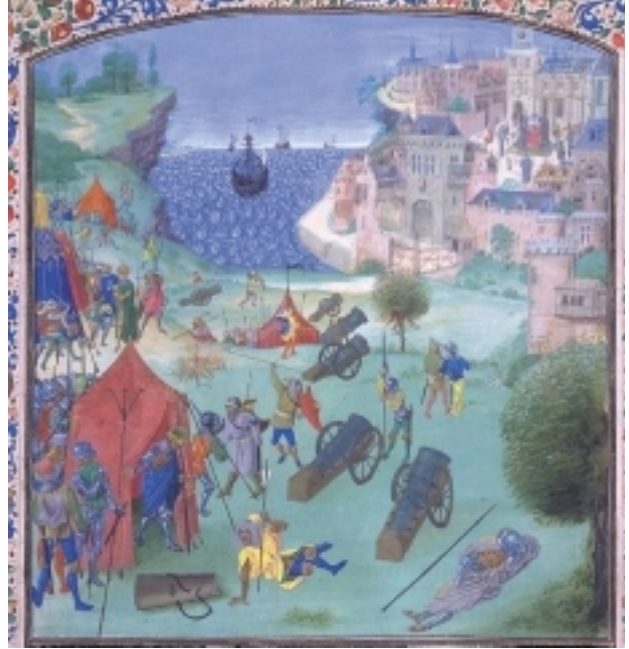
הקסטייליאנים כובשים את ליסבון (1384). ציור: ז'אן פרואטר

מדוע עשה ריימונדו סילבה, מגיה יסודי, ותיק ומסור, מעשה חמור כזה? אם נקרב מבטנו אל ריימונדו סילבה, נראה כי הספר תופס אותו בשלב בחייו שבו הוא עייף מן היחסים שעליו לקיים עם טקסטים. ◀