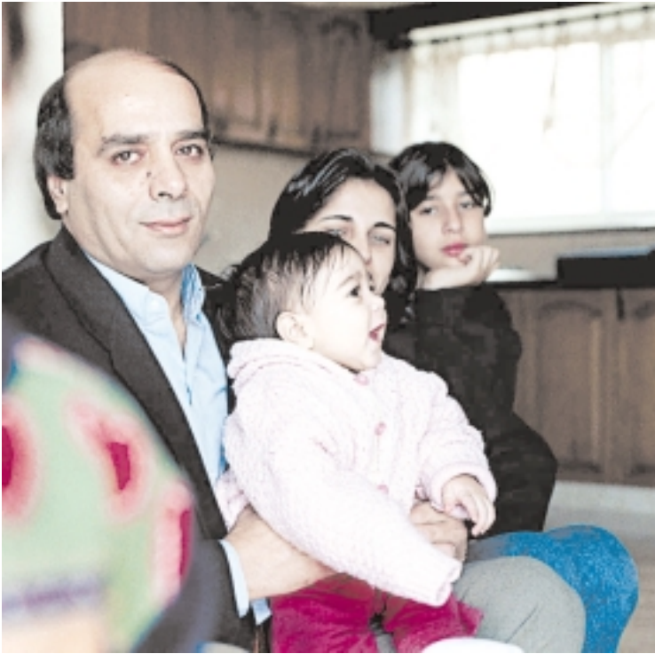
משפחת קעדאן.

מצוי תהליך הניסיון לנסח ולהוציא לפועל (to perform) זהות חדשה: המקום הקודם שתפסו הערבים בישראל צר ולא מספק, והמקום הבא עוד לא מגובש 47 . כשלב לימנלי, הוא מתאפיין בפתיחת כל השאלות הבסיסיות: מי אנחנו? מה שאיפותינו? מהם האופנים שבהם אפשר ורצוי לנו להשתלב במרחב הישראלי? מה הקשר שלנו לאוכלוסייה הפלסטינית בשטחים הכבושים, ולזהותנו הערבית במרחב הערבי הגדול יותר, במרחב התיכון?