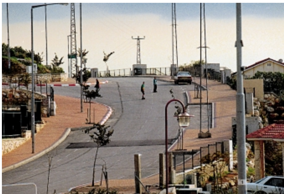
היישוב קציר.